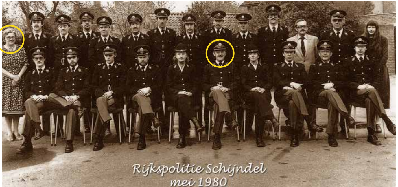
Rijkspolitie Schijndel mei 1980

De som van alle cijfers van dit telefoonnummer komt overeen met de schoenmaat van diegene die niet verdacht werd een touw te hebben gebruikt indien hij de moordenaar is.