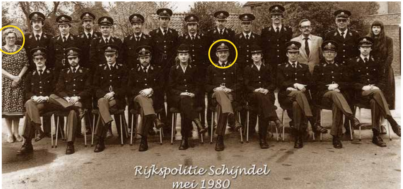
Rijkspolitie Schijndel mei 1980

De som van alle cijfers van dit telefoonnummer komt overeen met de schoenmaat van diegene die niet verdacht werd een touw te hebben gebruikt indien hij de moordenaar is.